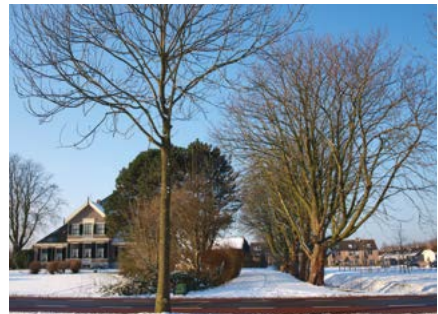
Boerderij Stad Zaandam

Een paar honderd meter verderop, aan de linkerkant van de weg op nummer 1092, ligt boerderij Onze Lust. Hier staat een paardenkastanje van 3 meter dik uit 1856. De tuin wordt onderhouden als stinzenplantentuin met veel wilde bolgewassen in het voorjaar. De volgende hoeve rechts is De Stad Zaandam uit 1857 op nummer 1071. Hiervan is alleen het dak in de loop der tijd vervangen. Langs de oprijlaan staan mooie kastanjes van 2,5 meter dik en een alleenstaande kastanje naast het huis uit 1857 van ruim 3,5 meter dik.